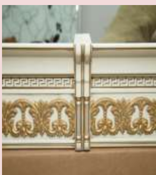
Стык фриза с соединителем